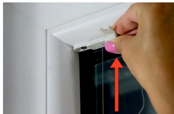
6. An den oberen Befestigungen sind die Nylonbänder bereits vormontiert. Die Befestigung auf den Spannfuß halten und das Nylonband spannen.