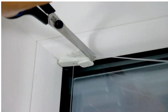
9. Das überschüssige Nylonband abschneiden.