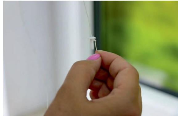
4. Knoten des Nylonbandes