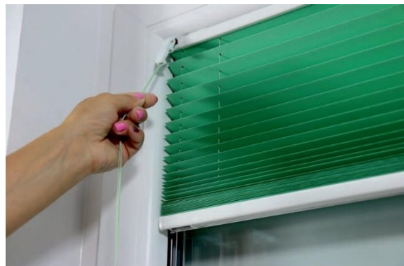
12. Das Plissee mit den Schnüren betreiben.