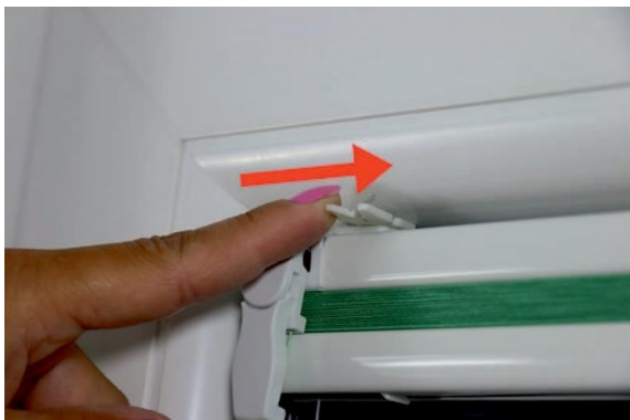
11. Befestigungsverschluss um 90° drehen um das Plissee zu fixieren.