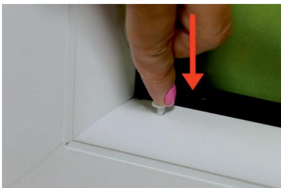
5. Als erstes das Nylonband, sowie den Knoten in das Loch einführen und anschließend das Nylonmontageelement in das Loch eindrücken.