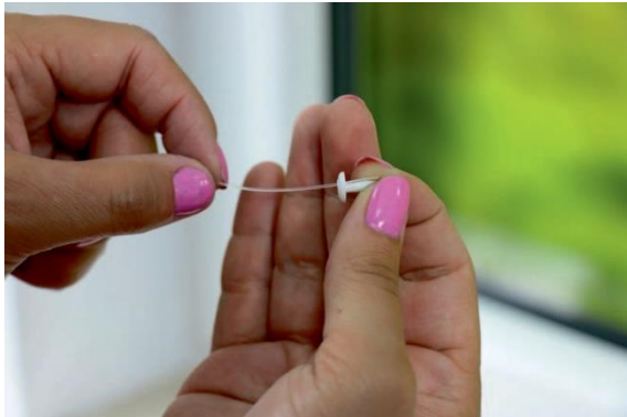
3. Nylonband fädeln