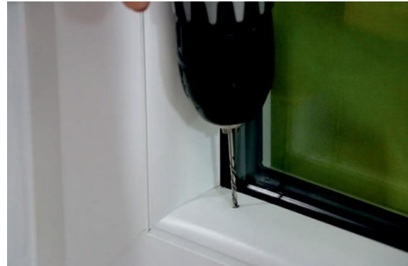
2. Loch bohren (2,5er Bohrer)