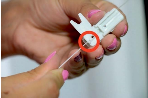
7. An der gewünschten Stelle einen Knoten binden.