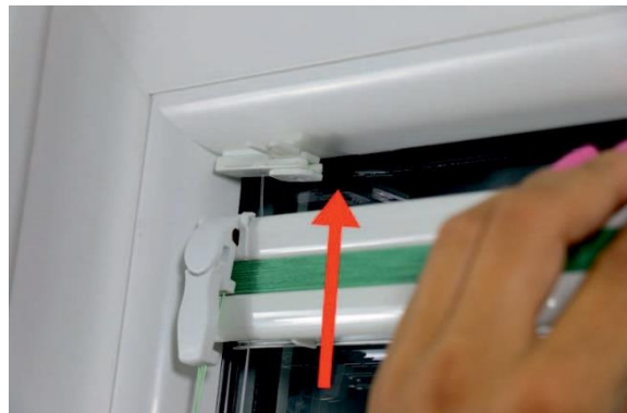
10. Das Plissee an der Befestigung anbringen.