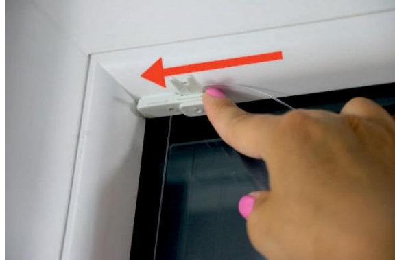
8. Die Befestigung mit dem gespannten Nylonband auf den Spannfuß schieben.